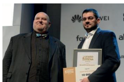
Grand Press Economy