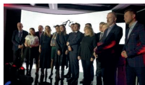
Nagroda im. Teresy Torzańkiej